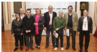
Los organizadores, en la presentación realizada en el Concello. la opinión

La organización Special Olympics organizará mañana en el Palacio de los Deportes los XX Juegos Autonómicos de Deportes Minoritarios, en los que participarán 382 deportistas con discapacidad intelectual pertenecientes a 21 asociaciones de la comunidad. A ellos se sumarán 93 entrenadores y un centenar de voluntarios. Las pruebas comenzarán a las 12.00 y concluirán a las 19.00 horas.