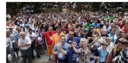
Algunos asistentes a la Special Olympics Galicia, en el parque municipal de O Carballiño.

R. IGLESIAS, ourense / la voz, 06 de julio de 2015, Actualizado a las 05:00 h.