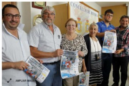
FOTO: C. Q. Los organizadores presentaron la prueba en el Concello. GALICIA.COM